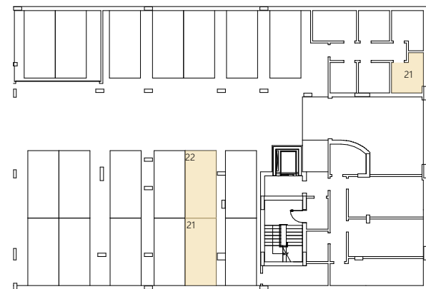
Piso -1 | Estacionamento N°21 e N°22 Arrecadação N°21 - 6,03m 2